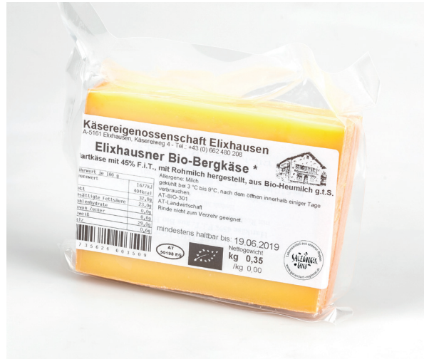
Anwendung s/w mit Rand