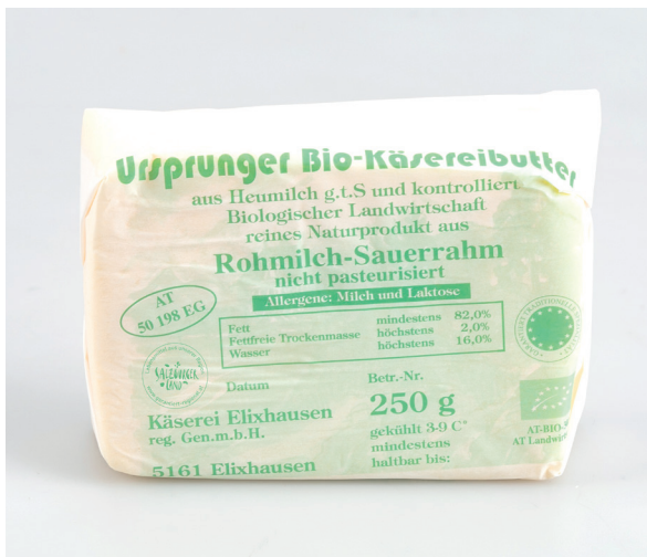
Anwendung 1c mit Rand